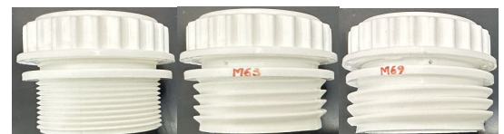
3種類の用取付アダプタ付き (MBSP (55) スチール缶用、M63、M69)

(日本輸入総代理店) S.H.W. 濱田産業株式会社 大阪府大阪市西区立売堀 3-2-12 TEL: 06-6541-5439 / FAX: 06-6541-5954 http://www.s-h-w.net