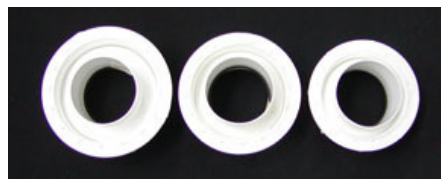
3種類の取付アダプタ付き (C55、C63、C65)